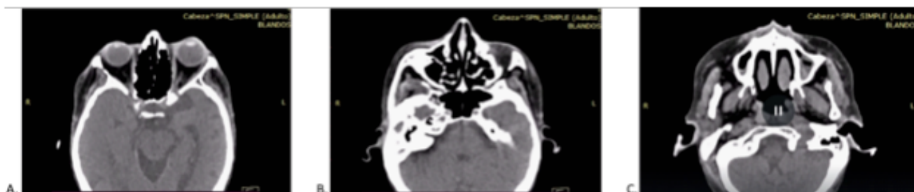
Imagen 2. Ocupamiento de los senos maxilares.