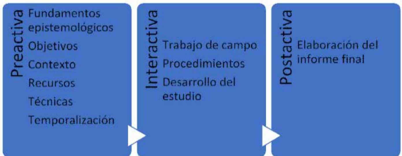
Tabla 2 Etapas de la investigación mediante estudios de caso Pérez Serrano y Martínez Bonafé

Tomando la clasificación de Pérez Serrano y Martínez Bonafé la investigación mediante estudios de casos se realizó en las siguientes tres fases generales: la fase preactiva, interactiva y postactiva como a continuación se muestra en la Tabla 2.