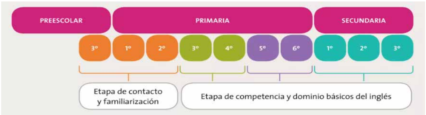
Tabla 1 Organización de los ciclos

Lengua Extranjera. Inglés se compone de dos etapas: una dirigida a los grados iniciales de educación básica cuya finalidad es promover en los estudiantes la familiarización y el contacto con el inglés como lengua extranjera; y la otra, destinada al resto de los grados que componen este nivel educativo, que tiene como objetivo la competencia y el dominio básico en esta lengua. Esta organización se sustentó en la propuesta curricular de la Universidad de Cambridge estableciendo el perfil de egreso para la conclusión de secundaria del nivel B1